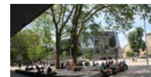
5. Am Rand Bleiben oder vertreiben