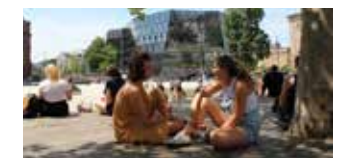
6. Begegnung Miteinander - nebeneinander