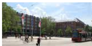
2. Umbau Natur vs. Architektur