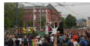
4. Bühne Sehen & gesehen werden