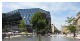
3. Synagogenbrunnen Denk-mal